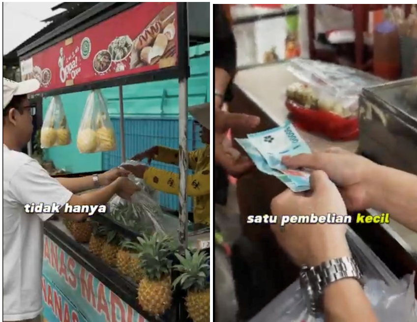
Figur 2. Dokumentasi Pembelian Produk UMKM