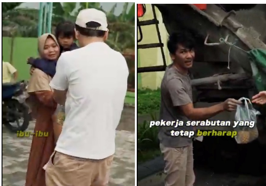
Figur 3. Dokumentasi Distribusi Paket