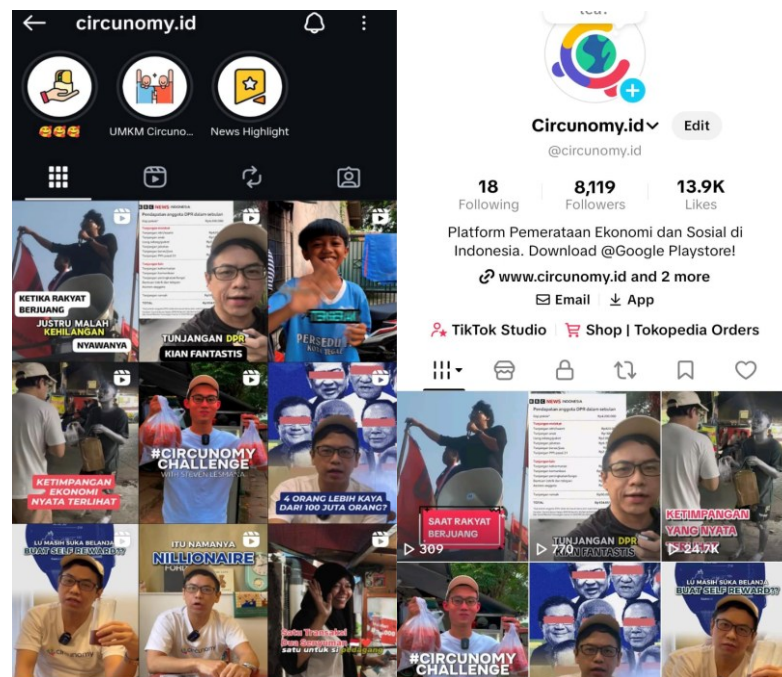
Figur 4. Dokumentasi Digital melalui Aplikasi Circunomy

Kegiatan ini melibatkan kolaborasi dengan berbagai pihak, termasuk komunitas lokal dan jejaring relawan. Keterlibatan masyarakat menengah ke atas ditekankan melalui kampanye sosial media dengan pendekatan contoh langsung ( role model ) dari tim inisiator.