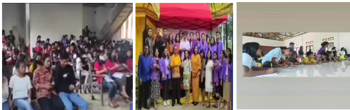
Figure 2. Pelayanan Anak

Adaptasi teknologi dalam pelayanan anak terbukti mampu meningkatkan partisipasi dan antusiasme anak dalam Sekolah Minggu 15 . Evaluasi dampak melalui survei, observasi guru, dan kuesioner orang tua memberikan data konkret mengenai keberhasilan program. Hal ini menegaskan bahwa inovasi berbasis kebutuhan zaman sangat penting dalam mempertahankan dan memperkuat pelayanan gereja terhadap generasi muda.