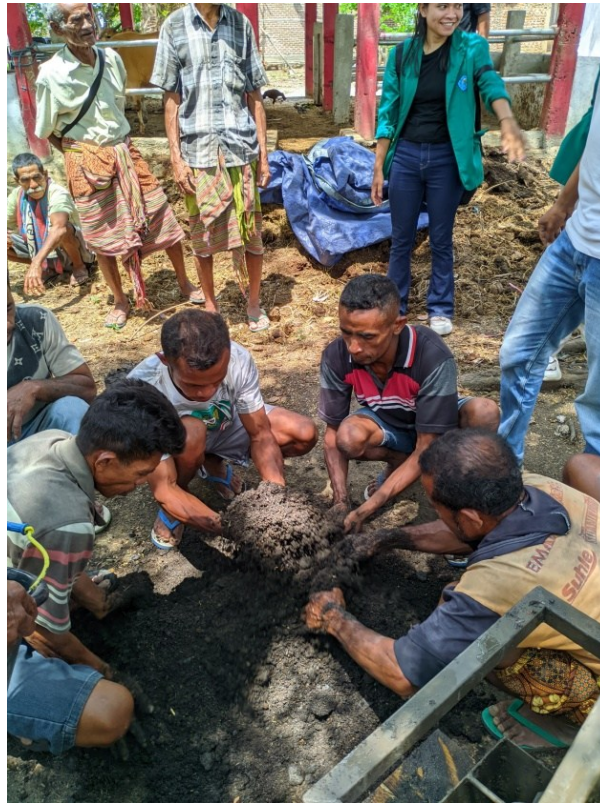
Figur 5. Proses Pencampuran Bahan Baku Kompos

proses pengomposan dapat berlangsung dengan baik. Selain itu, peserta juga diberikan panduan tentang cara memotong atau mencacah bahan yang besar agar lebih mudah terurai, sehingga mempercepat proses dekomposisi.