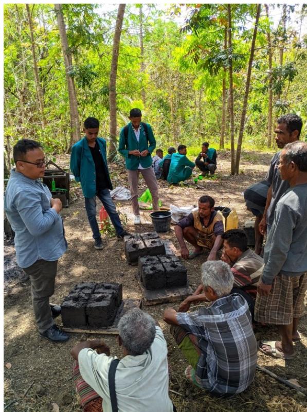
Figur 8. Respon Kelompok atas Penggunaan Alat Cetak Kompos

Para peserta juga diajarkan untuk memanfaatkan berbagai bahan tambahan atau pengikat alami untuk membantu mengikat kompos agar tetap padat dan mudah diproses. Penggunaan bahan pengikat ini penting untuk menjaga kekuatan fisik kompos blok, mengurangi kemungkinan kerusakan selama transportasi, dan meningkatkan daya tahan produk di lapangan. Dengan menggunakan bahan pengikat yang tepat, kompos blok tidak hanya dapat diproduksi dalam jumlah banyak, tetapi juga memiliki daya simpan yang lebih lama dan tidak mudah rusak. Hal ini memberikan nilai tambah bagi produk yang dihasilkan, baik untuk kebutuhan pribadi maupun komersial.