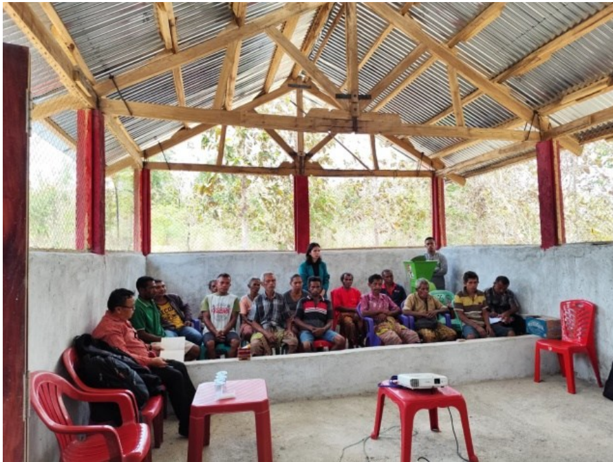
Figur 2. Sosialisasi Awal Pelaksanaan Kegiatan

proses pengomposan, tetapi kini kelompok mampu mengidentifikasi bahan-bahan yang diperlukan, serta memahami peran mikroorganisme dalam proses dekomposisi.