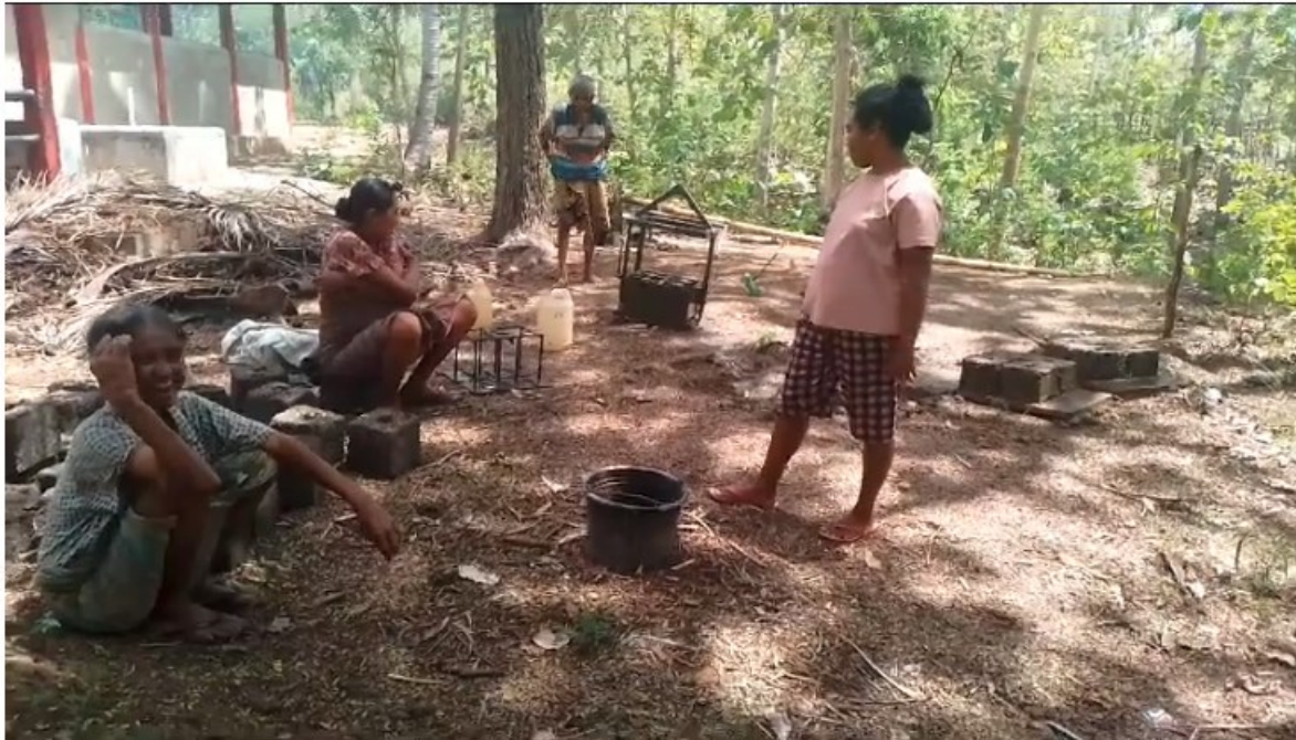
Figur 9. Kegiatan Pencetakan Kompos Oleh Anggota Kelompok