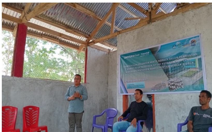
Figur 4. Penyuluhan Materi Pemberdayaan Kelompok Dalam Pengolahan Feses Sapi

Pelatihan yang diberikan mencakup berbagai teknik penting dalam pembuatan kompos blok, yang dirancang untuk memberikan pemahaman menyeluruh tentang proses pengolahan kotoran sapi dan bahan organik lainnya. Salah satu aspek pertama yang dibahas adalah cara yang benar untuk mengumpulkan bahan baku, seperti kotoran sapi, sekam padi, sisa tanaman, dan bahan organik lainnya. Para peserta diajarkan bagaimana memilih bahan yang tepat dan bagaimana cara mengumpulkannya secara efisien. Misalnya, diperkenalkan pada pentingnya menjaga keseimbangan antara bahan kaya karbon (seperti sekam) dan bahan kaya nitrogen (seperti kotoran sapi) agar