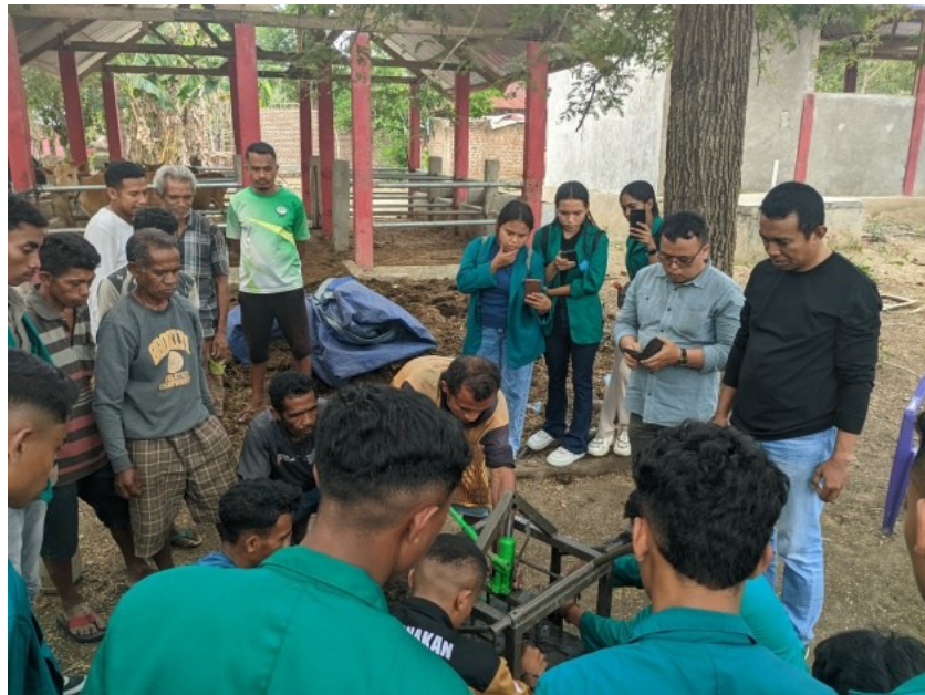
Figur 6. Proses Pencetakan Kompos Blok

Selain memperhatikan ukuran dan bentuk, proses pencetakan juga melibatkan keterampilan khusus agar kompos yang telah difermentasi tetap memiliki kestabilan fisik. Salah satu tantangan utama dalam pencetakan kompos adalah menjaga agar kompos blok tidak mudah hancur, meskipun telah melalui proses fermentasi yang intensif. Proses pencetakan yang tepat memungkinkan kompos blok untuk tetap padat dan terjaga konsistensinya, meskipun terpapar kondisi lingkungan seperti kelembaban atau suhu yang berubah-ubah. Dengan teknik pencetakan yang baik, kompos blok dapat diproduksi dengan kepadatan yang ideal, sehingga tidak hanya mudah disimpan, tetapi juga tahan lama dan efisien dalam pemanfaatannya sebagai pupuk.