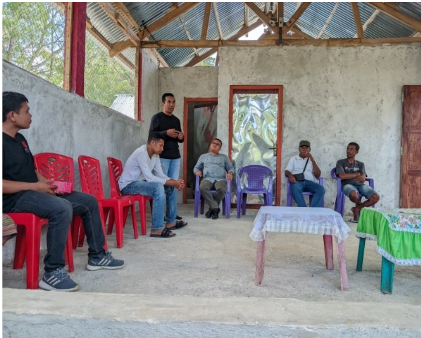
Figur 3. Penyampaian Materi Pemanfaatan Feses Sapi Menjadi Pupuk Kompos