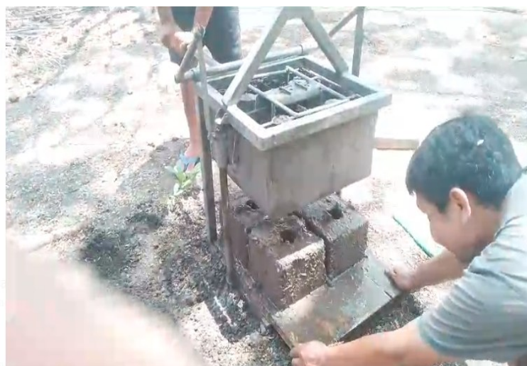
Figur 7. Proses Pencetakan Oleh Kelompok Pasca Pelatihan

Selain memperhatikan ukuran dan bentuk, proses pencetakan juga melibatkan keterampilan khusus agar kompos yang telah difermentasi tetap memiliki kestabilan fisik. Salah satu tantangan utama dalam pencetakan kompos adalah menjaga agar kompos blok tidak mudah hancur, meskipun telah melalui proses fermentasi yang intensif. Proses pencetakan yang tepat memungkinkan kompos blok untuk tetap padat dan terjaga konsistensinya, meskipun terpapar kondisi lingkungan seperti kelembaban atau suhu yang berubah-ubah. Dengan teknik pencetakan yang baik, kompos blok dapat diproduksi dengan kepadatan yang ideal, sehingga tidak hanya mudah disimpan, tetapi juga tahan lama dan efisien dalam pemanfaatannya sebagai pupuk.