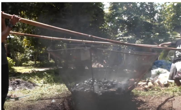
Figur 1. Pirolisis Biochar dari Limbah Pertanian