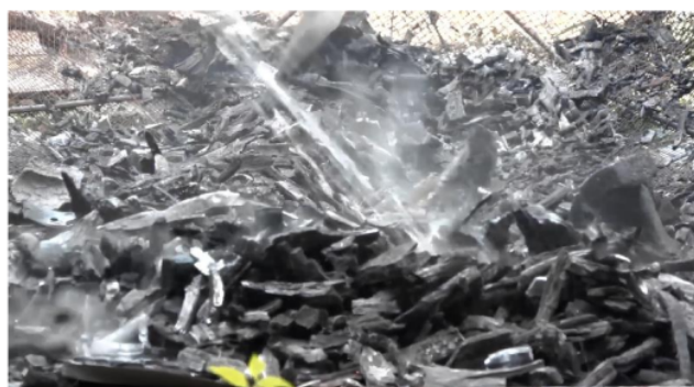
Figur 2. Hasil Pirolisis Limbah Pertanian

Biochar dari limbah pertanian hasil pirolisis nanti dimasukkan ke dalam tangki profil untuk proses penyaringan 10 . Biochar dimasukkan pada tangki profil pertama. Proses penyaringan pada tangki profil pertama untuk menyaring logam berat, zat kimia berbahaya lain, bakteri yang terkandung pada air 11 . Sementara tangki profil kedua diisi dengan adsorben lain yang berasal dari ijuk, sabut kelapa, kerikil, pasir yang bertujuan untuk menyerap sisa kotoran yang terlepas pada tangki profil pertama, sehingga air yang keluar dari tangki kedua sudah menjadi air yang layak untuk dikonsumsi. 12