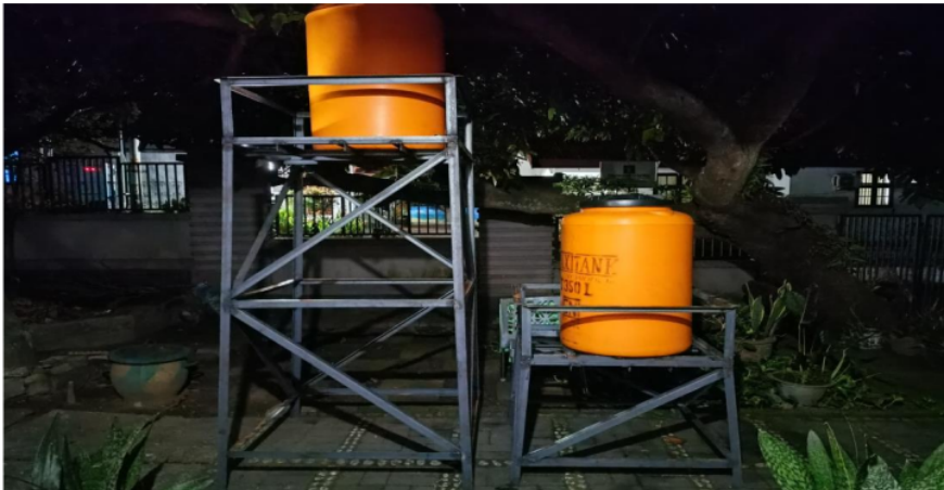
Figur 3. Tangki Profil Berisi Adsorben yang Digunakan sebagai Media Filter Air

Figur 3 menunjukkan tangki profil yang digunakan untuk penyaringan air. Kedua tangki disusun pada kedudukan yang dibuat di bengkel las. Kedua tangki memiliki fungsi yang berbeda. Tangki pertama untuk menyaring zat kimia berbahaya. Tangki kedua untuk menyaring kotoran berlebihan yang lolos.