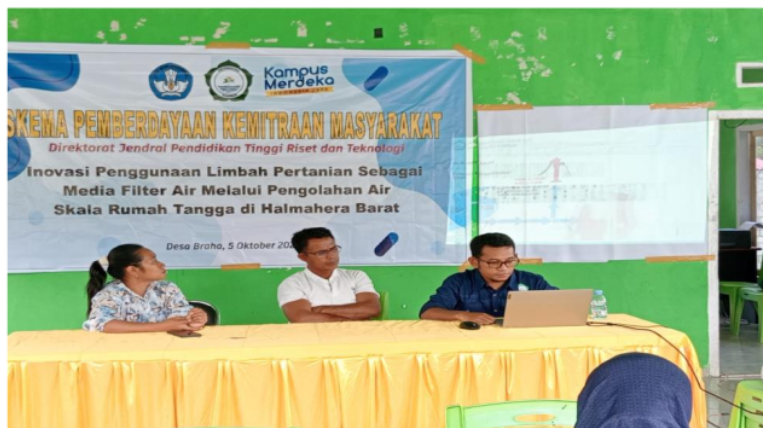
2 Figur 4. Sosialisasi Terkait Penggunaan Limbah Pertanian Sebagai Media Filter

berlebih dan kandungan zat kimia berbahaya. Selain itu, ada efek kronik yang ditimbulkan selama bertahun-tahun setelah logam berat dan pestisida yang terakumulasi di dalam tubuh. Efek kronik seperti penyakit kanker dan penyakit berbahaya lainnya. Sebab itu, 2 kandungan air yang mengandung logam berat mineral yang berlebih, zat organik berlebih pada air harus disisihkan dengan alat penyaring yang menggunakan berbagai macam media filter untuk proses adsorpsinya. Media filter yang murah, efisien, efektif, dan bahannya tersedia di desa adalah adsorben yang berasal dari limbah pertanian. Berikut adalah dokumentasi sosialisasi yang dilakukan di desa Braha pada 5 Oktober 2024.