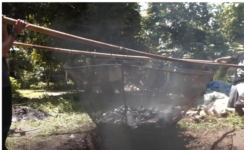
Figur 2. Pirolisis Biochar dari Limbah Pertanian

Pembuatan biochar dari limbah pertanian ini menggunakan kayu yang sudah tidak dipakai, daun, dan kulit buah yang dibakar dengan oksigen yang terbatas di lubang lalu ditutupi setelah sudah menjadi arang diangkat. Prosesnya diperlihatkan pada Figur 1 berikut: