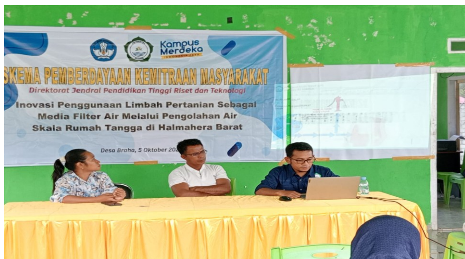
Figur 5. Sosialisasi Terkait Penggunaan Limbah Pertanian Sebagai Media Filter

Dalam sosialisasi ini juga disampaikan terkait dengan dampak buruk bagi Kesehatan masyarakat yang mengonsumsi air tanpa difilter terlebih dahulu yaitu menyebabkan penyakit seperti diare karena adanya kandungan bakteri ecoli yang berlebih dan kandungan zat kimia berbahaya. Selain itu, ada efek kronik yang ditimbulkan selama bertahun-tahun setelah logam berat dan pestisida yang terakumulasi di dalam tubuh. Efek kronik seperti penyakit kanker dan penyakit berbahaya lainnya. Sebab itu, kandungan air yang mengandung logam berat mineral yang berlebih, zat organik berlebih pada air harus disisihkan dengan alat penyaring yang menggunakan berbagai macam media filter untuk proses adsorpsinya. Media filter yang murah, efisien, efektif, dan bahannya tersedia di desa adalah adsorben yang berasal dari limbah pertanian. Berikut adalah dokumentasi sosialisasi yang dilakukan di desa Braha pada 6 Oktober 2024.