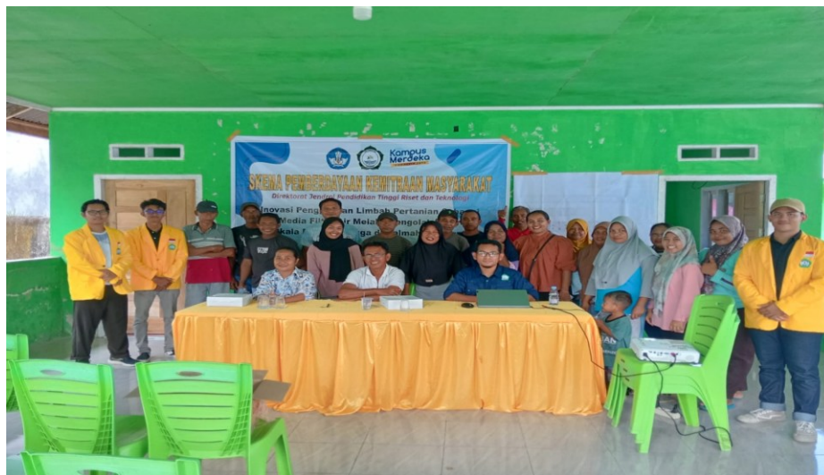
Figur 6. Foto Bersama dengan Perangkat Desa dan Masyarakat yang mengikuti sosialisasi

Sosialisasi mengenai inovasi teknologi sederhana dalam pengolahan air bersih merupakan langkah penting untuk meningkatkan kualitas hidup masyarakat Desa Braha, Kabupaten Halmahera Barat. Kegiatan ini bertujuan untuk menyebarkan informasi dan pengetahuan tentang cara memanfaatkan limbah pertanian—seperti kulit buah dan daun—sebagai bahan utama dalam pembuatan filter air. Mengingat bahwa sebagian besar masyarakat desa bergantung pada sumber air yang tidak selalu bersih, penerapan teknologi ramah lingkungan ini diharapkan dapat menjadi solusi praktis dalam menjamin ketersediaan air bersih yang aman untuk konsumsi sehari-hari. 32