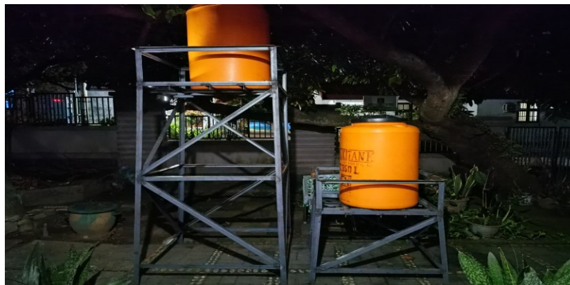
Figur 4. Tangki Profil Berisi Adsorben yang Digunakan sebagai Media Filter Air

Figur 3 menunjukkan tangki profil yang digunakan untuk penyaringan air. Kedua tangki disusun pada dudukan yang dibuat di bengkel las. Kedua tangki memiliki fungsi yang berbeda. Tangki pertama untuk menyaring zat kimia berbahaya. Tangki kedua untuk menyaring kotoran berlebihan yang lolos.