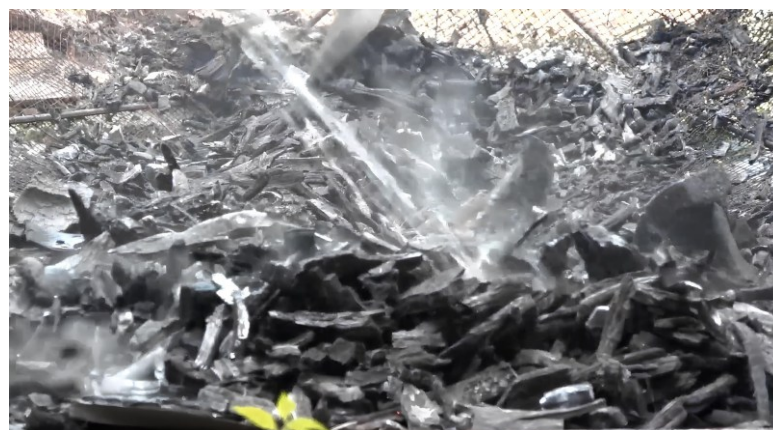
Figur 3. Hasil Pirolisis Limbah Pertanian