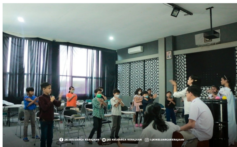
Figur 5. Bernyanyi Menggunakan Gerakan