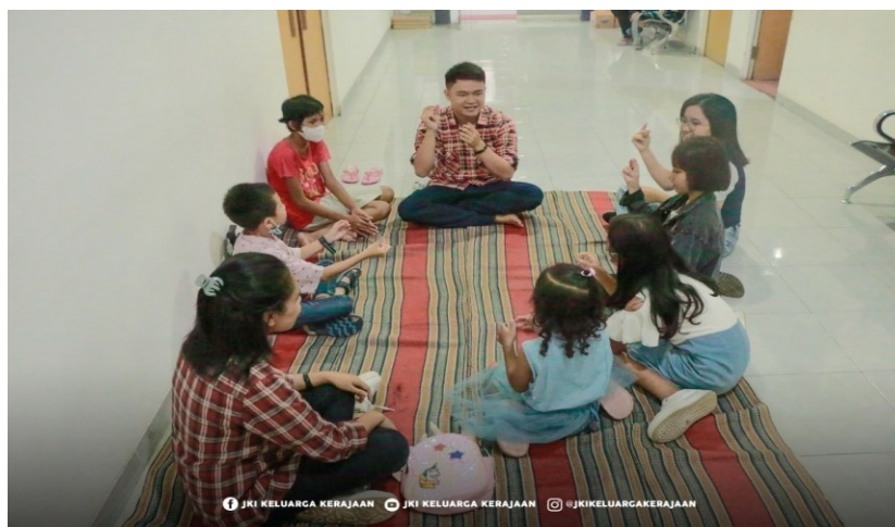
Figur 4. Anak-Anak Diajak Bermain Game