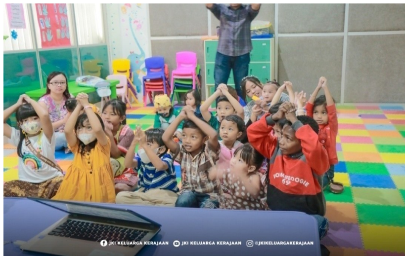
Figur 3. Bermain Game Bersama