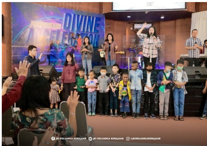
Figur 2. Doa gereja anak

Dalam penelitian ini penulis meneliti tentang Gereja anak di gereja JKI KK yang menumbuhkan semangat anak-anak agar tidak merasa bosan ketika mengikuti ibadah. Oleh karena itu para mentor tidak saja menggunakan metode cerita tetapi mereka juga menggunakan metode game dan pujian.