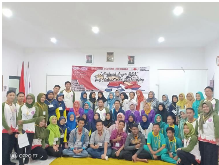
Figur 6. Peserta Pengabdian kepada masyarakat