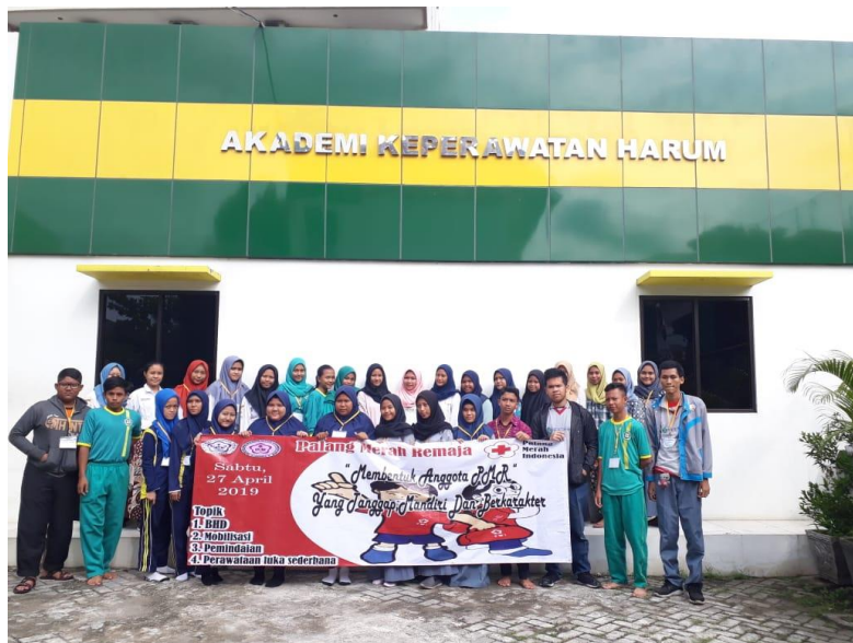
Figur 7. Peserta Pengabdian Kepada Masyarakat