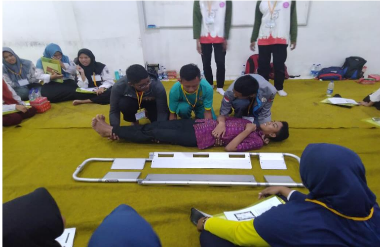
Figur 5. Ceramah Materi Immobilisasi, mengangkat, dan memindahkan pasien