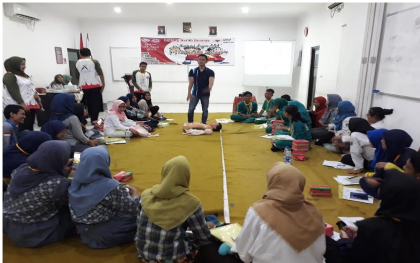
Figur 3. Ceramah Materi Bantuan Hidup Dasar

Hasil evaluasi ini diberikan kepada setiap peserta dalam bentuk skor, yaitu hasil jawaban benar dibagi jumlah soal dikalikan 100. Proses evaluasi dilakukan dengan memeriksa jawaban peserta atas pertanyaan-pertanyaan. Umpan balik diminta atau diberikan selama diskusi dan latihan. Penilaian akhir dilakukan dengan memberikan post-test kepada peserta yang terdiri dari soal-soal yang sama dengan pre-test . Skor post test dibandingkan dengan skor pre test . Jika skor post test lebih tinggi dari skor pre test , maka ukuran metodologi yang diberikan berhasil meningkatkan pengetahuan peserta.