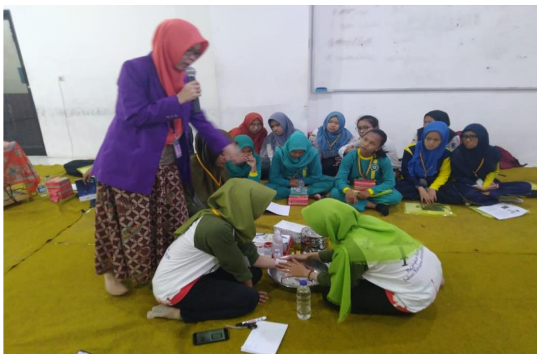
Figur 4. Ceramah Materi Perawatan Luka Sederhana