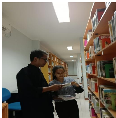
Figur 4 dan 5. Perpustakaan sebagai tempat menyenangkan untuk berdiskusi