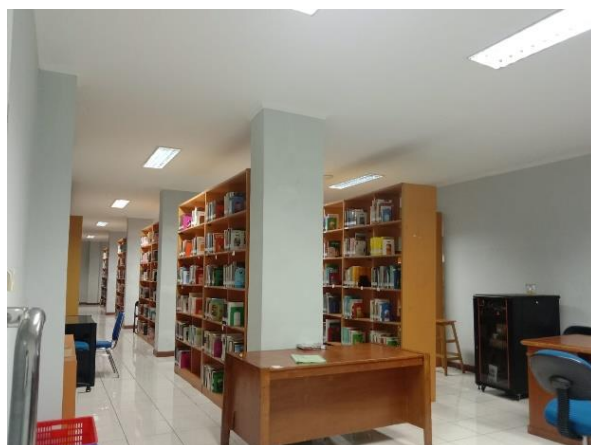
Figur 1. Ruang Perpustakaan

Perpustakaan sekolah telah memfasilitasi bahan-bahan koleksi seperti buku-buku yang bersifat fisik. Hal ini bisa membuat mahasiswa menjadi mandiri dengan melakukan proses belajar individual dan berkelompok. Terlebih perpustakaan Sekolah Tinggi Teologi Moriah telah melengkapi koleksi-koleksi perpustakaan dengan buku-buku yang bersifat pengetahuan. Data di atas dapat dibuktikan dengan dokumen tertulis dari buku kunjungan yang ada di perpustakaan yang mana di dalamnya juga terdapat keterangan kegiatan peserta didik atau pengunjung yang mengunjungi perpustakaan sekolah.